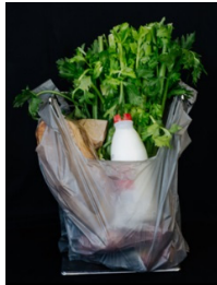
高密度聚乙烯 (标准石油化工) 轻型塑料购物袋