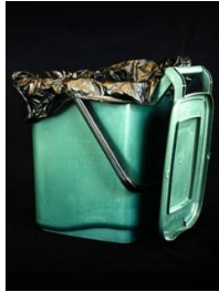
垃圾袋和垃圾箱衬袋