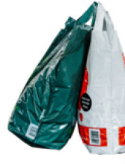
再利用または複数回の使用を 想定した、丈夫なプラスチック製の バッグ

レジ袋の提供禁止についてさらに詳しくは、クイーンズランド州政府のウェブサイトでレジ袋の提供禁止についてのページをご覧ください。 www.qld.gov.au/plasticbagban