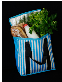
再利用可能な 冷凍用バッグ