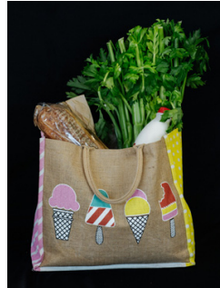
再利用可能な 厚手の麻布の バッグ