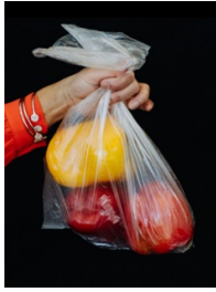
包装されていない果物、野菜、肉、魚などの生鮮食料品のための包装袋