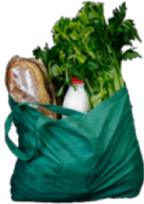
再利用可能な 緑色のポリプロピレン製の バッグ

買い物に出かける際には、以下に写真を掲載したような再利用可能なバッグを持参しましょう。こうしたバッグを玄関や車の中に置いておけば準備万端です。