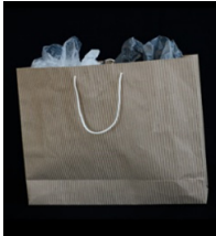
紙袋またはボール紙の袋