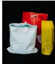
重量のある、デパートで提供されるタイプのプラスチック製袋