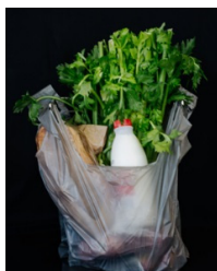
高密度ポリエチレン（標準的な石油化学系）の軽量レジ袋